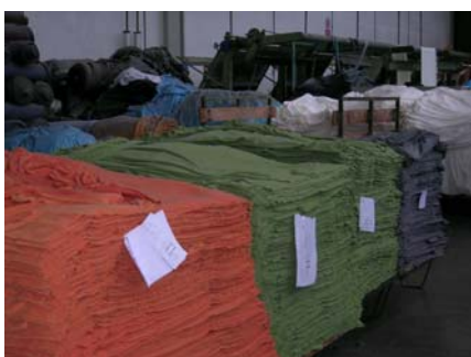
Tessuti in lavorazione in una tintoria

addetti e il 37% delle aziende. Una crisi che sarà metabolizzata dal sistema locale nel corso degli anni '90 grazie all'ispessimento delle funzioni terziarie (con il rapido incremento del settore dei servizi alle imprese), ma soprattutto al riposizionamento verso produzioni a maggior valore aggiunto e al procedere della differenziazione dell'offerta (ad es. pile, ciniglia...). In questi anni, grazie anche alla svalutazione della lira e ad una congiuntura internazionale favorevole (soprattutto dal '93 in poi), il distretto procede a imponenti investimenti produttivi con un significativo potenziamento della fase della nobilitazione, che diventa un segmento sempre più