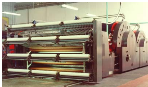
Impianti di filatura cardata

La seconda metà degli anni '80 si presenta come un periodo generalmente difficile. Il distretto ha dovuto soprattutto smaltire l'eccesso di investimenti in produzioni laniere cardate realizzato nei decenni precedenti, visto che il mercato di queste tipologie si contrae repentinamente. Vengono perduti in questo periodo il 28% degli