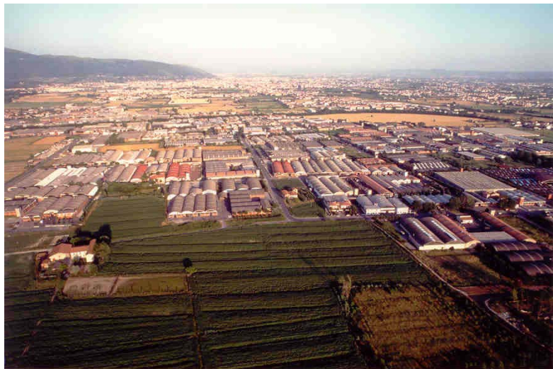
Veduta di un'area industriale

Nel corso degli anni, i cinesi hanno anche mostrato una tendenza ad una sorta di "integrazione verticale etnica" con l'acquisizione di imprese terziste rispetto alla attività di confezione (tintorie e trattamenti capo) e in generale di fornitura (ad es. accessori) o servizio alle loro imprese (consulenza, informatica...) e di servizio alla loro comunità (commercio, servizi alla persona...).