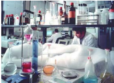
Laboratorio dell'Istituto Buzzi

Pochi numeri testimoniano l'entità del fenomeno. Secondo gli ultimi dati disponibili, il 10,7% dei residenti nella provincia di Prato è costituito da stranieri: la percentuale più alta fra le province italiane; il Comune di Prato tocca il 12% di residenti stranieri contro una media italiana del 5,0% e contro il 7,6% e 7,3% di Lombardia e Veneto (le due regioni italiane che contano il maggior numero di stranieri). Nel 1990 si contavano 169 cinesi residenti nel Comune di Prato: all'inizio del 2007 ne risultavano iscritti all'anagrafe 10.077. Nel marzo 2007 erano attive 3.177