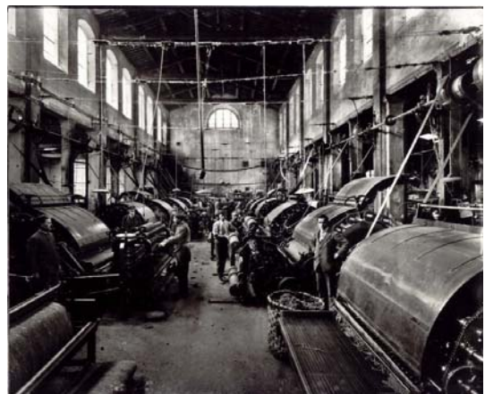
Interno di un'antica fabbrica

Questi "modelli competitivi" si sono affermati in funzione di processi di adattamento al mutare delle condizioni esterne ma anche in funzione della capacità del sistema locale di generare elevata varianza e innovazione nei percorsi imprenditoriali e quindi di offrire adeguato materiale per i processi di selezione concorrenziale e di cambiamento evolutivo.