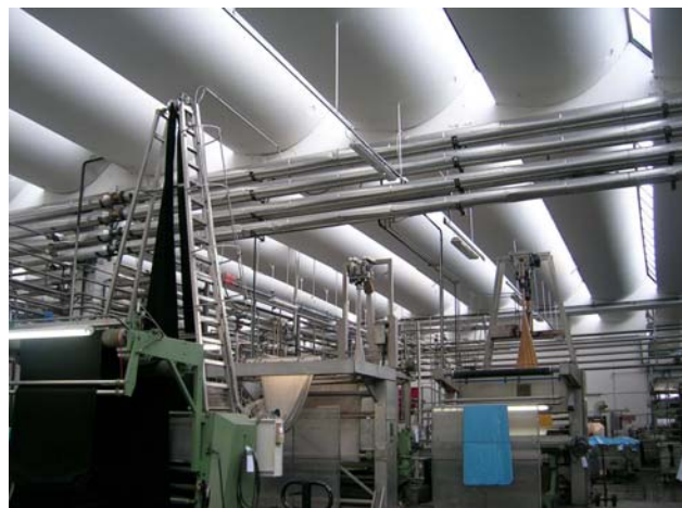
Interno di una rifinizione

La capacità di confrontarsi con questi orizzonti strategici dipende anche da determinanti endogene al sistema locale e cioè dalla capacità di adottare strategie adeguate non solo da parte delle imprese ma anche della "comunità distrettuale" complessivamente intesa.