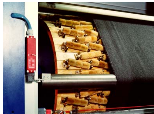
Garzatura con metodi naturali per fibre nobili

Il mondo della moda (i protagonisti mondiali del prêt-à-porter , i confezionisti con marchi industriali, i grandi retailer industriali) chiederà da allora a Prato