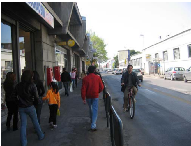
I cinesi a Prato

La crescita dell'economia pratese negli anni successivi al secondo dopoguerra ha espresso una "domanda di lavoro" e, più in generale, prodotto opportunità di impiego che non hanno potuto essere soddisfatte con l'esclusivo ricorso all'offerta della popolazione residente. Prato è stata, quindi, un grande magnete che ha attivato flussi di immigrazione a raggi diversi nel corso dei passati decenni. Flussi che ne hanno fatto, con una progressione impressionante, la terza città dell'Italia centrale e che hanno prodotto una urbanizzazione ininterrotta della piana tra Firenze e Pistoia.