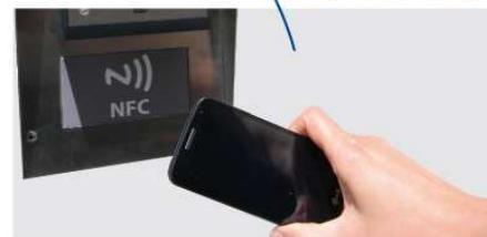
Controllo accessi tramite tecnologia NFC