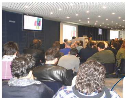
Sale riunioni attrezzate