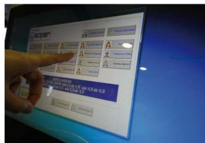
Centralino VoIP integrato con apparati di video-citofonia, controllo accessi e sistema anti-intrusione. Pannello touch per front line